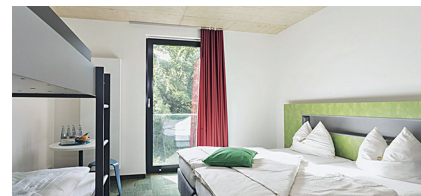
© Jugendherberge Gemünd Vogelsang, 53937 Schleiden